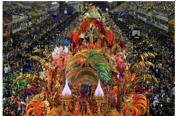
Η σχολή samba Beija-Flor παρελαύνει στο Καρναβάλι, 17 Φεβρουαρίου 2015.

Το Καρναβάλι στο Ρίο, στη Βραζιλία θα διεξαχθεί από τις 9 έως τις 14 Φεβρουαρίου 2018, και σε πολλές άλλες χώρες της Ευρώπης, της Καραϊβικής, της κεντρικής και νότιας Αμερικής όπως οι Αρούμπα, Ντομίνικα, Γουαδελούπη, Αιτή, Παναμάς, Πουέρτο Ρίκο, Τρινιντάντ και Τομπάγκο, Ιταλία, Ισπανία, Καναδάς και ΗΠΑ για τον εορτασμό της έναρξης της Μεγάλης Σαρακοστής. Πρόκειται για μια από τις μεγαλύτερες εκδηλώσεις μαζικής εστίασης που προσελκύει σημαντικό αριθμό επισκεπτών. Η προσεκτική προετοιμασία πριν το ταξίδι θα βοηθήσει τους ταξιδιώτες να έχουν ένα ασφαλές και ευχάριστο ταξίδι.